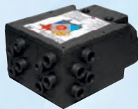
Múltiplas derivações ajustáveis através do sistema de tubagem direto às grelhas