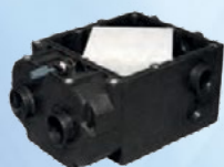
Permutador de fluxo cruzado

Equipado com sistema By-Pass, o qual pode ser activado no interruptor fornecido, de modo a refrescar o ar da habitação no verão, quando a temperatura interior for superior à exterior. Este desvia a maioria do ar viciado do permutador de modo a rejeitá-lo, assim o ar renovado encontra-se filtrado sem fazer permutação térmica.